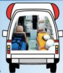
救急搬送車における オゾンガス消毒装置搭載