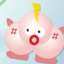
オゾンアシテーター オーサン