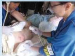
2011年3月の東日本大震災被災地での活動