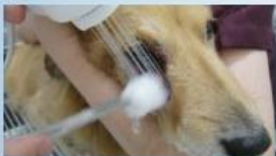
潰瘍で抗菌剤が効かない症例へのオゾン水利用