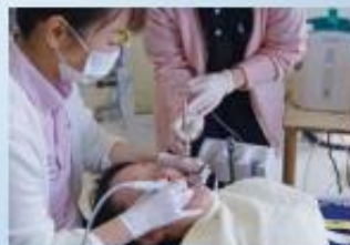
オゾン水を使った治療風景